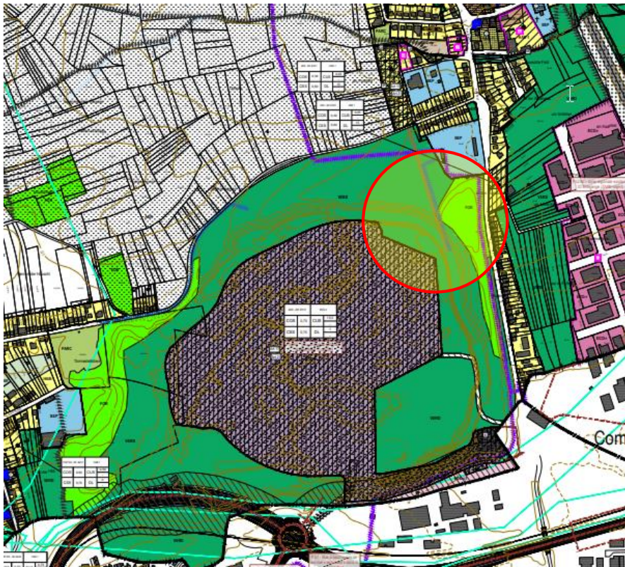
Extrait vum PAG (Partie graphique)