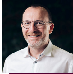
Georges Engel, Bürgermeeschter Bourgmestre