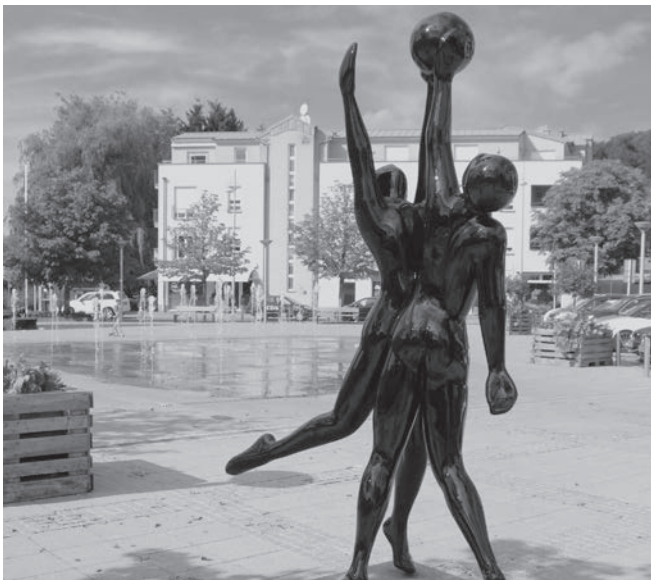
Dotierter Architektenwettbewerb für neue Maison Relais und Musiksaal in Zolwer sorgt für längere Diskussion.

Eine Machbarkeitsstudie aus dem Jahr 2009 hatte sich mit den gemeindeeigenen und benötigten Infrastrukturen beschäftigt und wie man diese optimal ausbauen könnte. Einige Ideen wurden in den vergangenen Jahren bereits umgesetzt. Damals gab es noch keine „Epicerie solidaire“ im selben Gebäude.