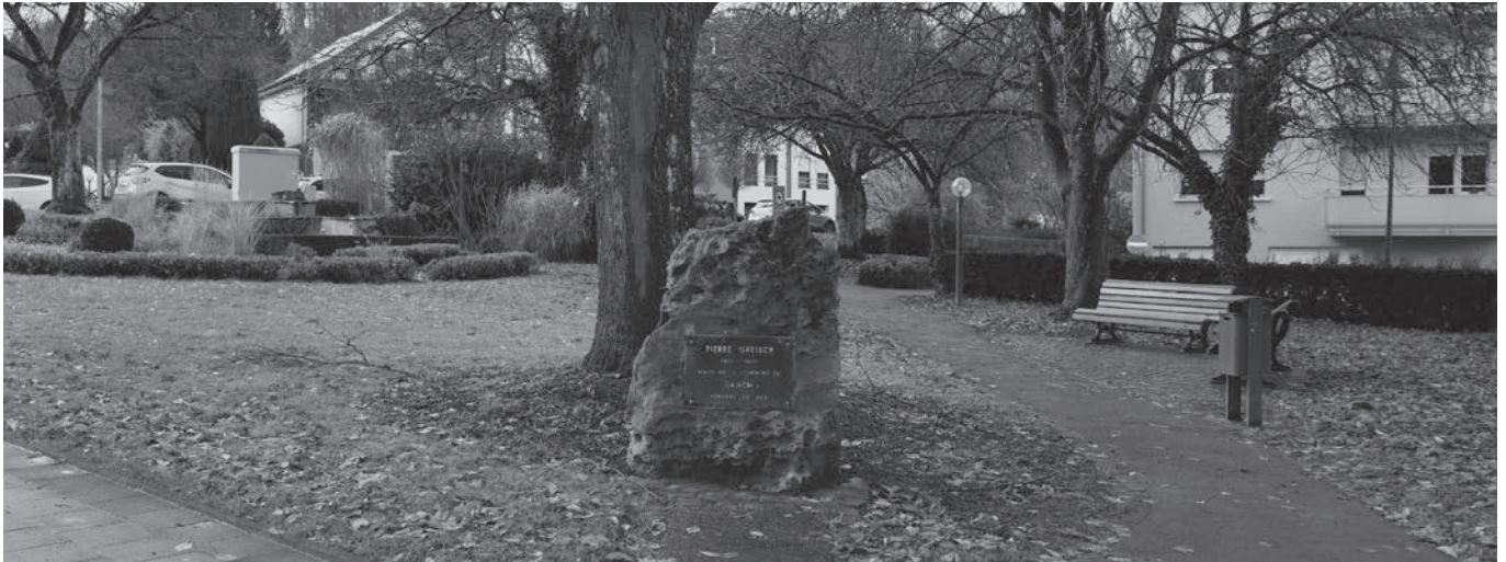
Ort des Geschehens: Place Pierre Greisch in Beles.

gereicht wurden). 116 Personen waren am Abend der Versammlung anwesend, davon allerdings nur 22, die zuvor eine schriftliche Beschwerde eingeschickt hatten.