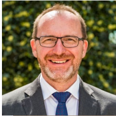
Georges Engel, Buergermeeschter