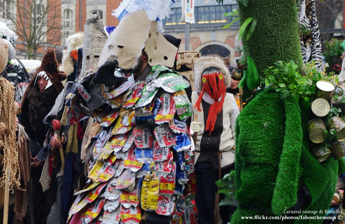
Carnaval sauvage de Bruxelles